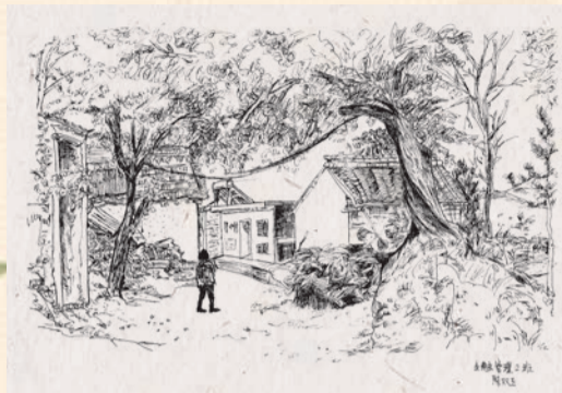
▲《回家》 20级金融管理2班 陈双玉