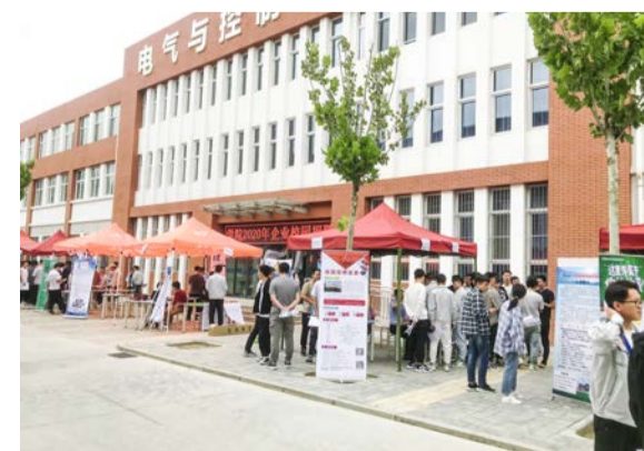
▲2020年秋季高校毕业生就业招聘会

“对企业来说，市场需求不是没有了，而是很多转移到了线上，相应的岗位需求也上了网。”疫情期间，学校主动作为、多点布局，搭建供需平台，深挖就业岗位，较早实施了“云招聘”，利用微信、QQ、公众号等新媒体渠道向社会广泛介绍各专业特色和各二级学院毕业生优势，持续向毕业生推送用人单位招聘信息，开启“互联网+就业”新工作模式，保证就业与服务不断线，网络招聘推荐不停歇。（组织宣传处、商贸学院、招生就业指导处 供稿）