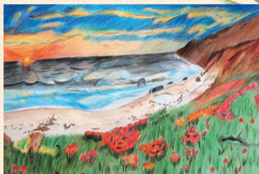
▲《梦想开始的地方》 20级会计7班 张婉妮