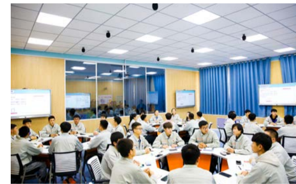
▲学生在智慧课堂上课

为有效改善学校教育教学硬件条件，推进信息技术与教育教学深度融合，今年，学校以宁夏作为全国“互联网+教育”示范区为契机，对公共教学区普通多媒体教室进行了升级改造。截至目前，教务处已建成3间精品智慧教室，31间常规智慧教室，为教学部门相关专业课程的实验实训需求提供保障，也为学生日常上课提供了优质的学习环境。实训装备处本年度新增教学科研仪器设备值为811.64万元，面向学院35个专业学生实践教学使用实训基地频率为2138263人时，为社会各企业职工技能培训与鉴定320923人时。