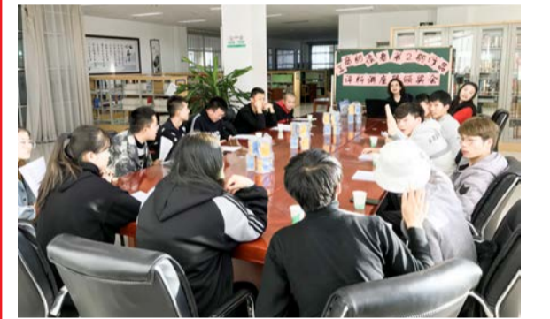
▲工商朗读者作品赏析会

“天堂应是图书馆的模样”，汇聚起积极向上的幸福力量，读者的满意就是图书馆人的幸福！（图书馆 供稿）