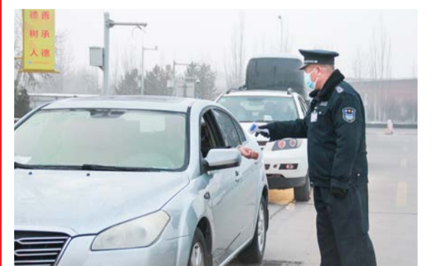
▲保安值守疫情防控第一道防线

著名的教育家陶行知先生把关爱、宽容、信任、激励融进了教育的“四颗糖”里，在工商学院里，老师在学习和生活中时时不忘给学生分享这“四颗糖”，学校也在老师的成长和成才上提供“四颗糖”，全体工商人共同努力，让工商人的幸福感、获得感、安全感延续。