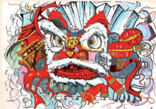
▲《年》 20级会计3班 李嘉瑞